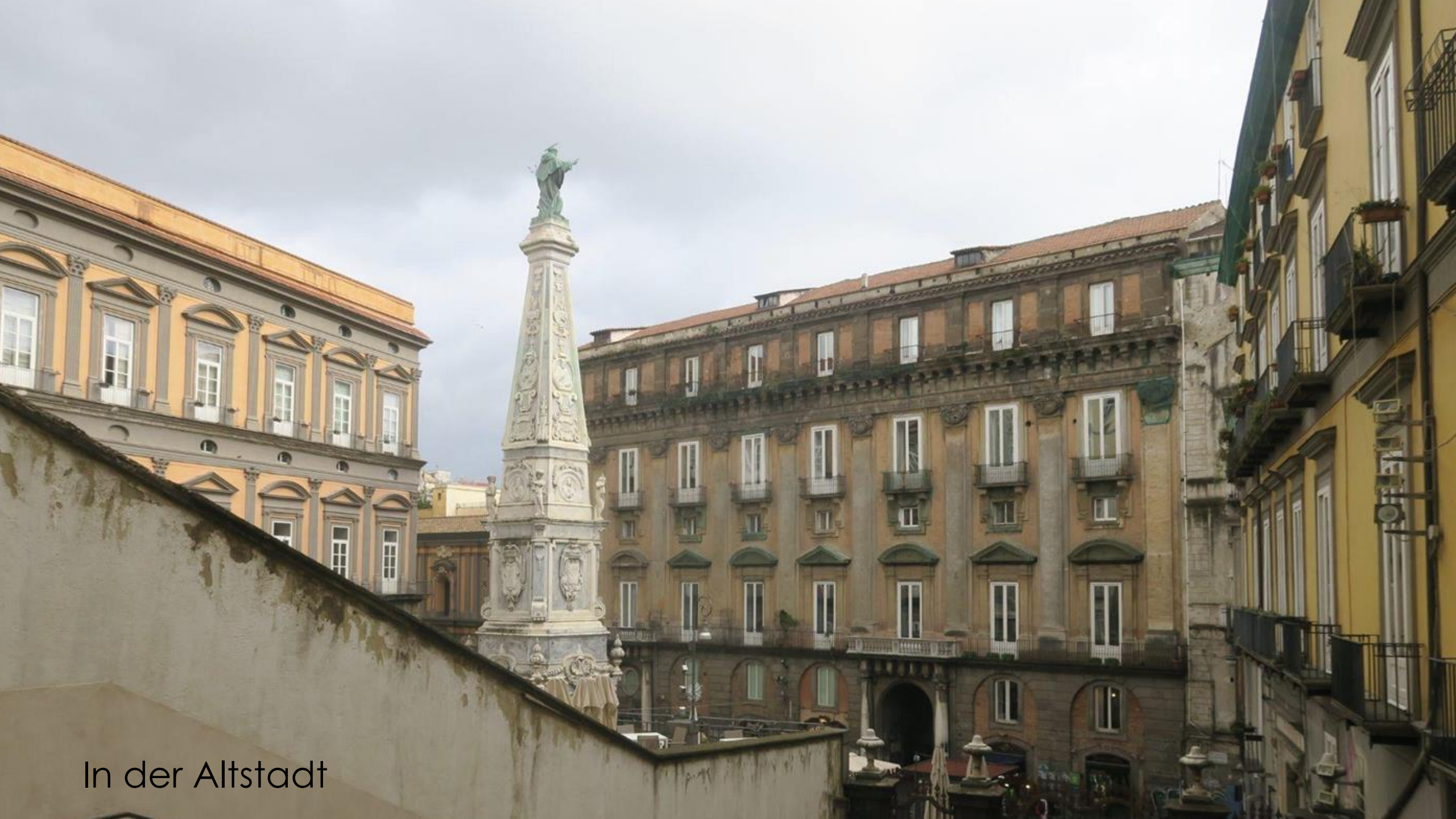
In der Altstadt